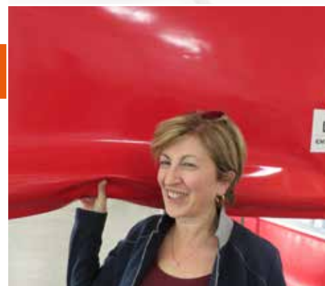
Bord inférieur flexible